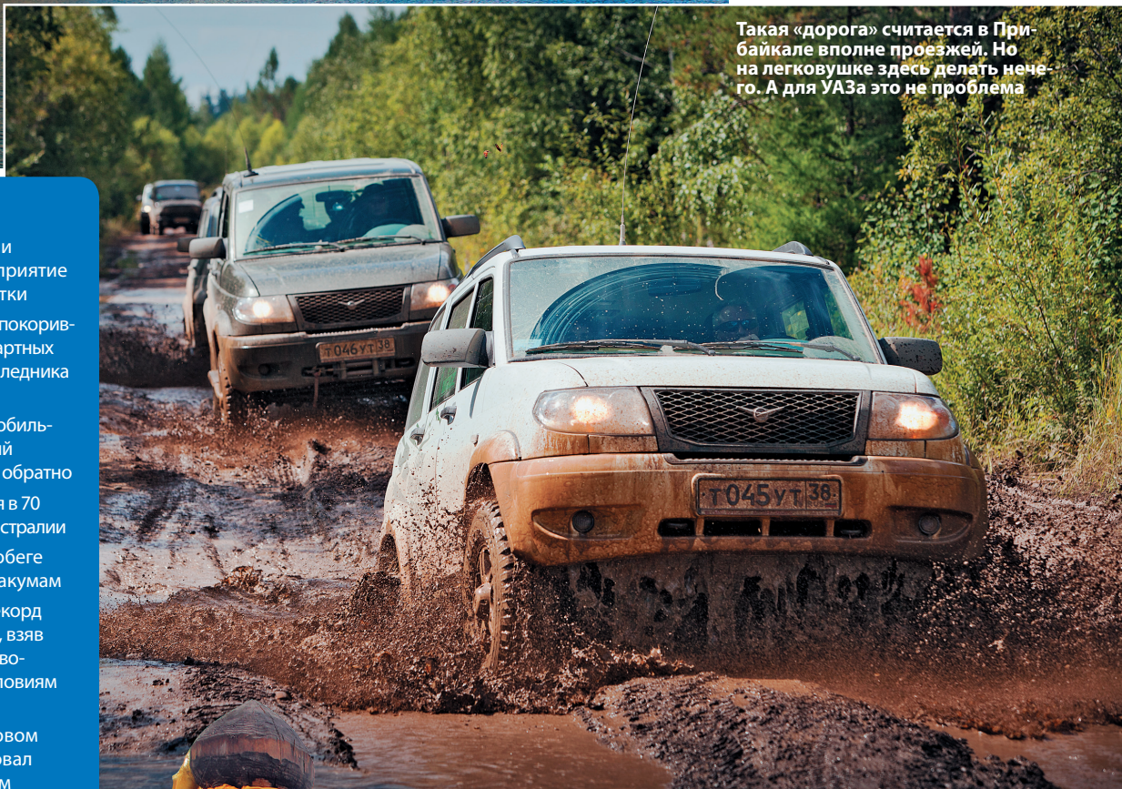
Такая «дорога» считается в Прибайкалье вполне проезжей. Но на легковушке здесь делать нечего. А для УАЗа это не проблема

Именно эта строка из песни на слова Дмитрия Давыдова вспоминается, когда речь заходит о Байкале. Местные называют его морем и призывают к тому приезжих – в знак уважения к этому месту, священному для многих. Считается, что название Байкалу дало монгольское словосочетание Байгал Далай, что означает большое море, или тюркское Бай-Куль – богатое озеро (аналогично Иссык-Куль – теплое озеро, Кара-Куль – черное озеро). Площадь Байкала, одного из крупнейших озер мира, составляет около 31,5 тыс. кв. км, что примерно равно площади таких стран, как Бельгия, Нидерланды или Дания. И это самое глубокое озеро в мире (средняя глубина – около 730 м