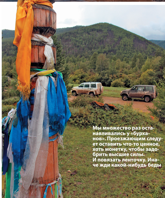
Мы множество раз останавливались у «бурханов». Проезжающим следует оставить что-то ценное, хоть монетку, чтобы задобрить высшие силы. И повязать ленточку. Иначе жди какой-нибудь беды