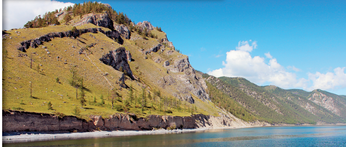
Кристалльно чистый воздух делает небо непривычно голубым, а краски – яркими, как в детских книжках