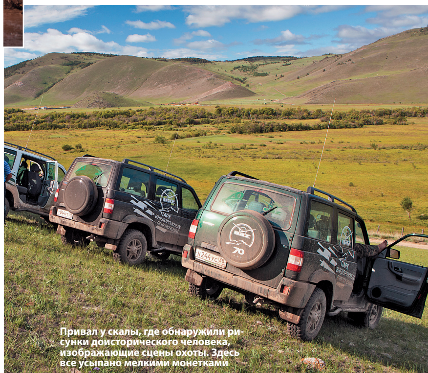
Привал у скалы, где обнаружили рисунки доисторического человека, изображающие сцены охоты. Здесь все усыпано мелкими монетками

Что же касается Байкала, я уверен, что вернусь к нему. Например, на следующий юбилей завода. С радостью. ■■■